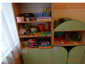
Уголок изобразительной деятельности

Кисточки, альбомы, ножницы, пластилин, непроливайки – стаканчики, цветные карандаши, простые карандаши, фломастеры, стаканы пластмассовые для карандашей, трафареты, цветные мелки, салфетки из ткани, восковые карандаши 12 цвет, цветная бумага, картон цветной, картон белый, раскраски клей – карандаш, игра настольная: «Цвета». Доски для пластилина, баночки для клея, гуашь 12 цв, краски 16 цв., точилка «Улитка», краски акварельные на каждого ребёнка, подставки под кисточки, декоративные печатки и штампики для рисования 20 шт, трафареты для работы с пластилином, стеки на каждого ребёнка. Портреты «Мир искусств».